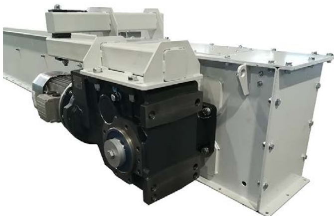
Figure 3 – Tipologia di trasporto redler utilizzato

Inoltre, le caratteristiche ed i vantaggi che tali soluzioni offrono sono: